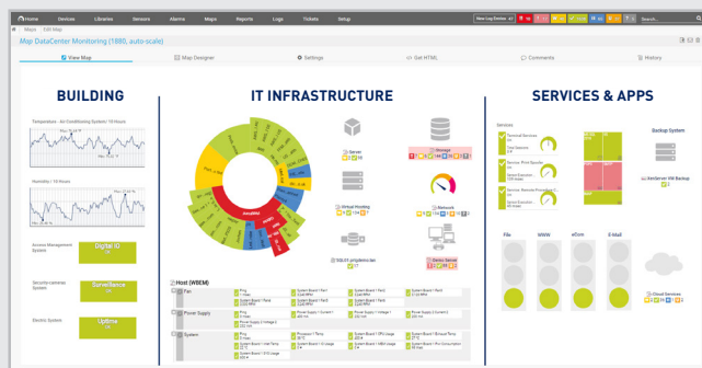
Su centro de datos de un vistazo